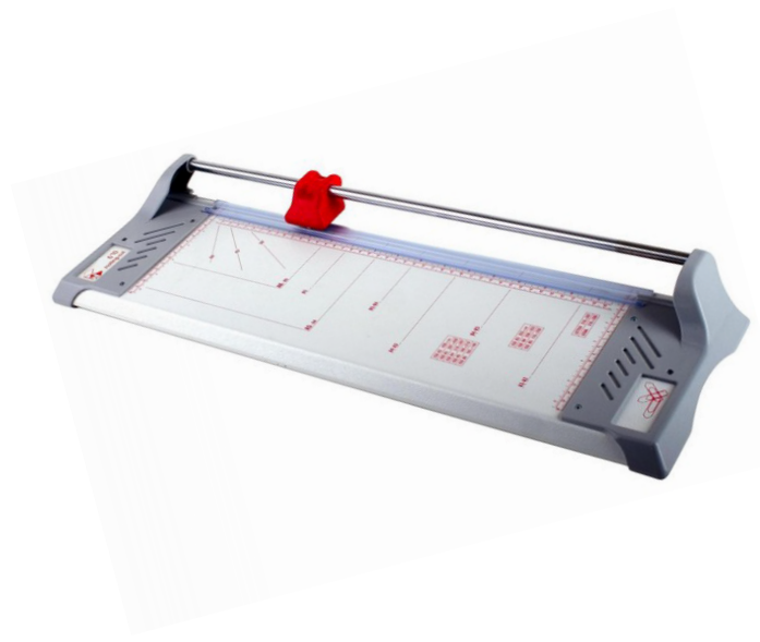
Dimensiones 670 (An x Pr x Al) 855 x 200 x 70 mm Peso 2.1 Kg

Cizalla de rodillo con base de construcción metálica con margenes en platico reforzado. Cabezal de corte de seguridad ergonómico con cuchilla de acero endurecido. Pisón de sujeción transparente y automático. Pintura en polvo anti arañazos. Escuadra extensible con escala en milímetros y pulgadas. Transportador con indicaciones de alineación en la barra de sujeción y en la tabla de corte para cortes angulares precisos. Regla en cm y pulgadas de medida en la mesa de corte. Construcción sólida y resistente a golpes. Ancho de corte A2. Capacidad de corte 12 / 8 hojas.