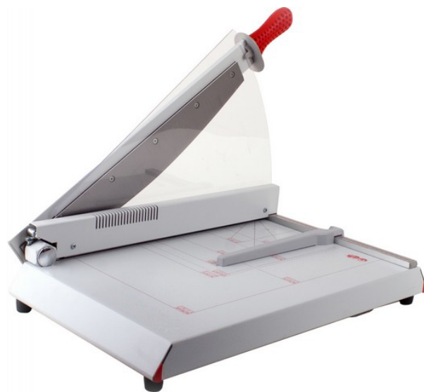
Dimensiones 560 C (An x Pr x Al) 835 x 495 x 525 mm Peso 15 Kg

Cizalla de palanca con pisón automático para un corte preciso y cómodo. Amplia mesa de sólida construcción totalmente metálica. Cuchillas reafilables de alta calidad hechas de acero reforzado. Protección fija de la cuchilla de color transparente con indicador de línea de corte integrado para un alineamiento exacto del papel a cortar. Tope lateral de precisión y escuadra trasera ajustable. Ancho de corte 560 mm. Capacidad de corte hasta 45 / 40 hojas. Grosor de corte 5 mm. Escala de medidas en mm puestas.