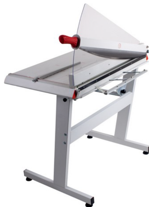
Dimensiones 710 (An x Pr x Al) 1000 x 615 x 605 mm Peso 25.1 Kg

Cizalla de palanca con pisón automático para un corte preciso y cómodo. Amplia mesa de sólida construcción totalmente metálica. Cuchillas reafilables de alta calidad hechas de acero reforzado. Protección fija de la cuchilla de color transparente con indicador de línea de corte integrado para un alineamiento exacto del papel a cortar. Tope lateral de precisión y escuadra trasera ajustable. Ancho de corte 10 mm. Capacidad de corte hasta 28 / 25 hojas. Grosor de corte 3 / 5 mm. Escala de medidas en mm / pulgadas.