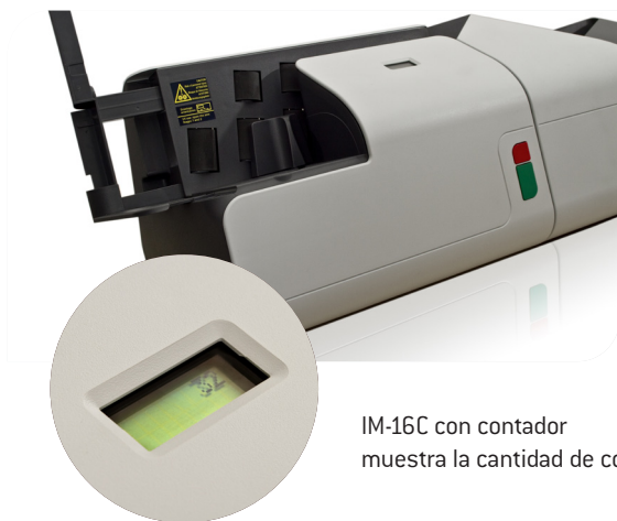
IM-16C con contador muestra la cantidad de correo entrante

Con su método de apertura innovador, la IM-16 elimina desperdicios sin dejar restos de papel por toda la oficina. Su tamaño compacto facilita su ubicación en la oficina, también facilita su desplazamiento y almacenaje.