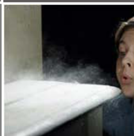
Polvo y partículas flotantes