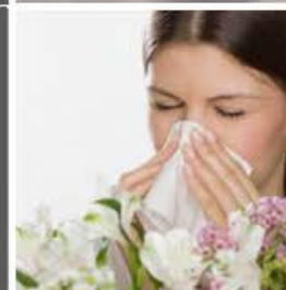
Polen y alergenos