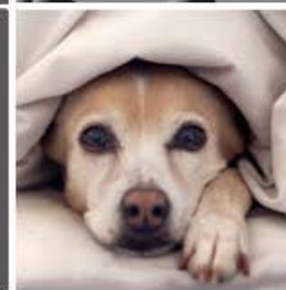
Pelo de su mascotas