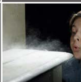
Polvo y partículas flotantes