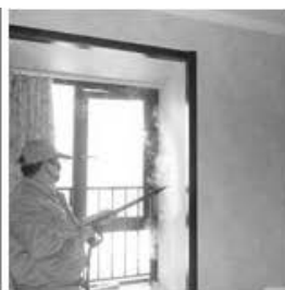
Contaminación del hogar