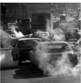
Emissiones de automóviles