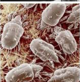
Ácaros y similares