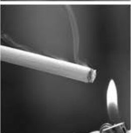
Humo de cigarrillos