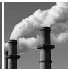
Contaminación de las industrias