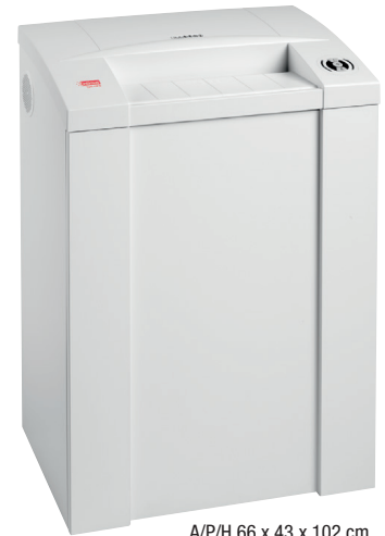
A/P/H 66 x 43 x 102 cm

Destructoras profesionales – la síntesis entre tecnología, rendimiento y diseño. Todas las destructoras intimus® se fabrican empleando componentes duraderos, precisos y de alto rendimiento, diseñados para tener una larga vida útil con una elevada carga de trabajo. La gama de productos cubre todas las exigencias desde uso diario en oficinas hasta máquinas destructoras de alta seguridad que se utilizan para destruir material clasificado de conformidad con todas las normativas legales vigentes, como DIN 66399 o NSA 02/01. Las destructoras intimus® incorporan varias características que las hacen únicas en cuanto a facilidad de manejo y eficiencia de trabajo.