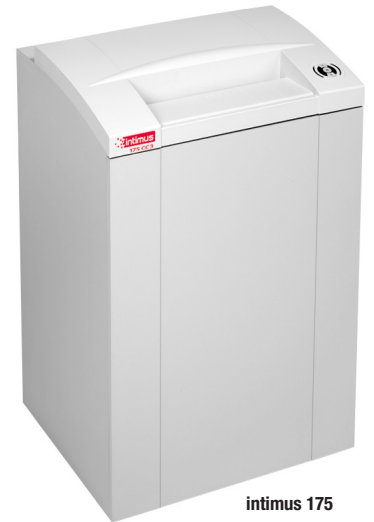
intimus 175 66 x 56 x 105 cm

La síntesis entre tecnología, rendimiento y diseño. Todas las destructoras intimus® se fabrican empleando componentes duraderos, precisos y de alto rendimiento, diseñados para tener una larga vida útil con una elevada carga de trabajo. La gama de productos cubre todas las exigencias desde uso diario en oficinas hasta máquinas destructoras de alta seguridad que se utilizan para destruir material clasificado de conformidad con todas las normativas legales vigentes, como DIN 66399 o NSA 02/01. Las destructoras intimus® incorporan varias características que las hacen únicas en cuanto a facilidad de manejo y eficiencia de trabajo.