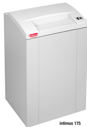
intimus 175 66 x 56 x 105 cm

La síntesis entre tecnología, rendimiento y diseño. Todas las destructoras intimus® se fabrican empleando componentes duraderos, precisos y de alto rendimiento, diseñados para tener una larga vida útil con una elevada carga de trabajo. La gama de productos cubre todas las exigencias desde uso diario en oficinas hasta máquinas destructoras de alta seguridad que se utilizan para destruir material clasificado de conformidad con todas las normativas legales vigentes, como DIN 66399 o NSA 02/01. Las destructoras intimus® incorporan varias características que las hacen únicas en cuanto a facilidad de manejo y eficiencia de trabajo.