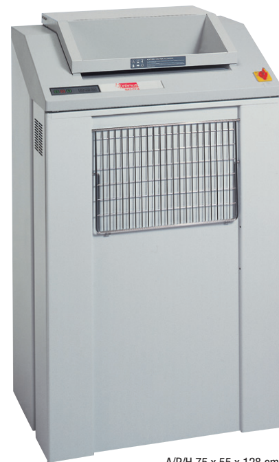
A/P/H 75 x 55 x 128 cm

Las destructoras intimus® incorporan varias características que las hacen únicas en cuanto a facilidad de manejo y eficiencia de trabajo.