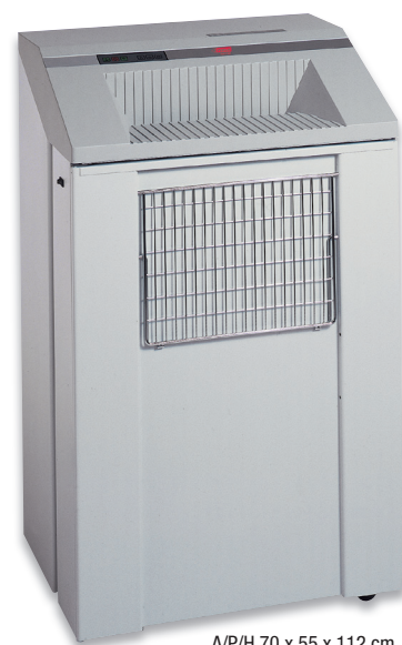
A/P/H 70 x 55 x 112 cm

Destructoras profesionales – la síntesis entre tecnología, rendimiento y diseño. Todas las destructoras intimus® se fabrican empleando componentes duraderos, precisos y de alto rendimiento, diseñados para tener una larga vida útil con una elevada carga de trabajo. La gama de productos cubre todas las exigencias desde uso diario en oficinas hasta máquinas destructoras de alta seguridad que se utilizan para destruir material clasificado de conformidad con todas las normativas legales vigentes, como DIN 66399 o NSA 02/01. Las destructoras intimus® incorporan varias características que las hacen únicas en cuanto a facilidad de manejo y eficiencia de trabajo.