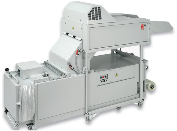
A/P/H 268/327 x 80 x 164 cm

Durante décadas, las destructoras de alto rendimiento intimus® han demostrado ser piezas esenciales del equipo empleado para desechar los medios que ya no se utilizan con la máxima privacidad. La gama de productos incluye diferentes variantes con capacidad para gestionar hasta 550 hojas por hora o incluso carpetas enteras en una única operación. La espaciosa bandeja de entrada con cinta transportadora integrada permite cargar el material sin esfuerzo y de manera rápida y segura. El material destruido se recoge en contenedores móviles de gran formato situados debajo del mecanismo de corte. Los combos destructora-prensa se acoplan para compactar el material destruido en fardos de manera rápida y totalmente automática. El efecto reductor comparado con los sistemas individuales es de aproximadamente un 70%.