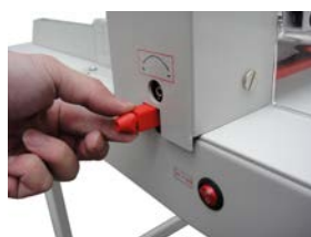
Fácil accesibilidad introducción y extracción del listón de corte, desde el exterior del equipo