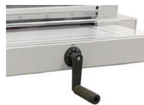
Ajuste profundidad de la escuadra trasera, preciso y rápido mediante manivela