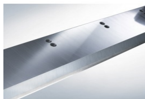
Cuchilla del mejor acero reforzado para llevar a cabo un corte fiable, preciso y de alta durabilidad.